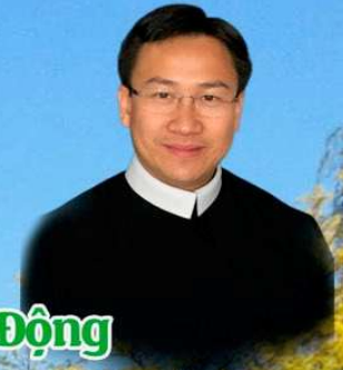
GIẢNG THUYẾT LM PHERO NGUYỄN BA QUỐC LINH CSSR